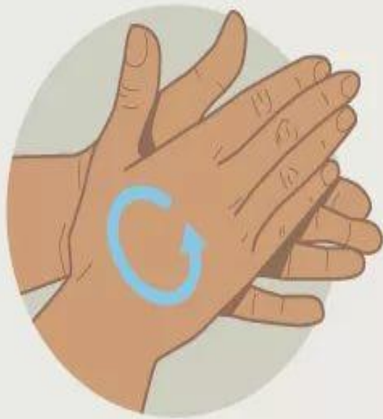
Ладонь к ладони