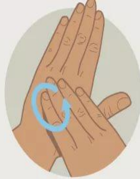
Тыльные стороны кистей