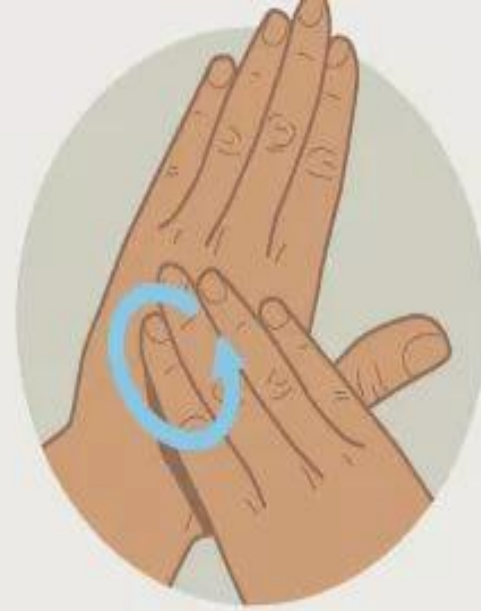
Тыльные стороны кистей