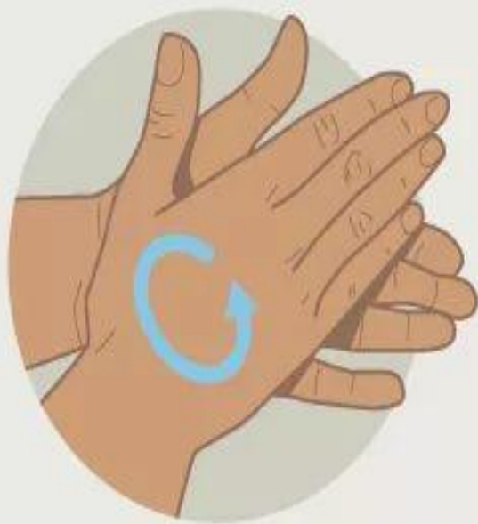
Ладонь к ладони