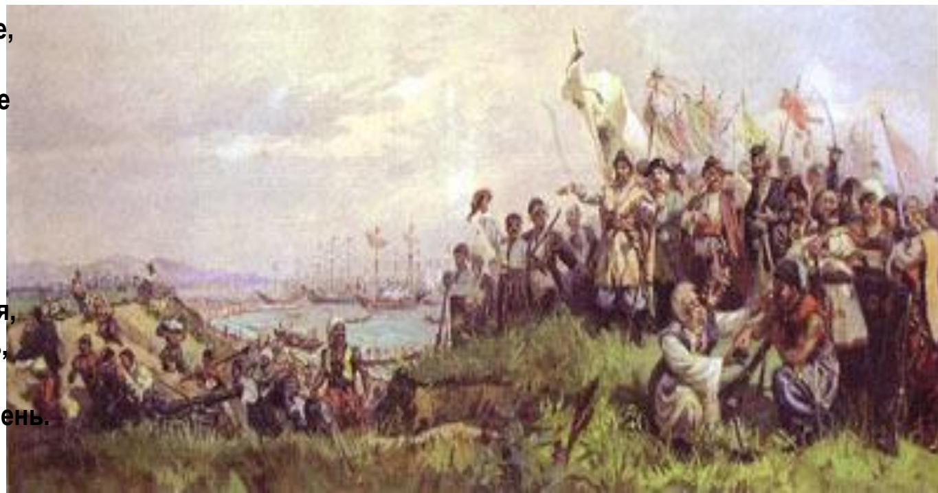
А.А. Чечин. Высадка казаков на Тамань.

Стоял мой предок на кургане, Смотрел вокруг из-под руки. Плескались волны на лимане Орел чертил свои круги. И не одной души в округе Цикады нарушали тишь. Земля, не тронутая плугом, Качала травы и камыш. Потом к воде казак спустился, Кушак и шапку бросил в тень, Напился и перекрестился... И вдруг представил свой курень. Он думал:»Добрая пшеница Уродится на целине... И в хатках беленьких станица Ему явилась как во сне.