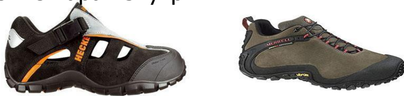
Летняя легкая обувь

Обувь из высокотехнологичных мембранных материалах для высоких и средних температур. Мембранный материал такой обуви(Gore-Tex) рассчитан на препятствие проникания влаги во внутрь и хорошее испарение пара изнутри.