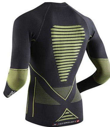
POLARTEC THERMAL PRO POLARTEC HIGH LOFT