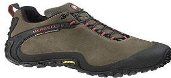
Летняя легкая обувь

Обувь такого типа рассчитана на высокие температуры. Система вентиляции позволяет беспрепятственно испарять влагу .В случае промокания быстро высыхает.