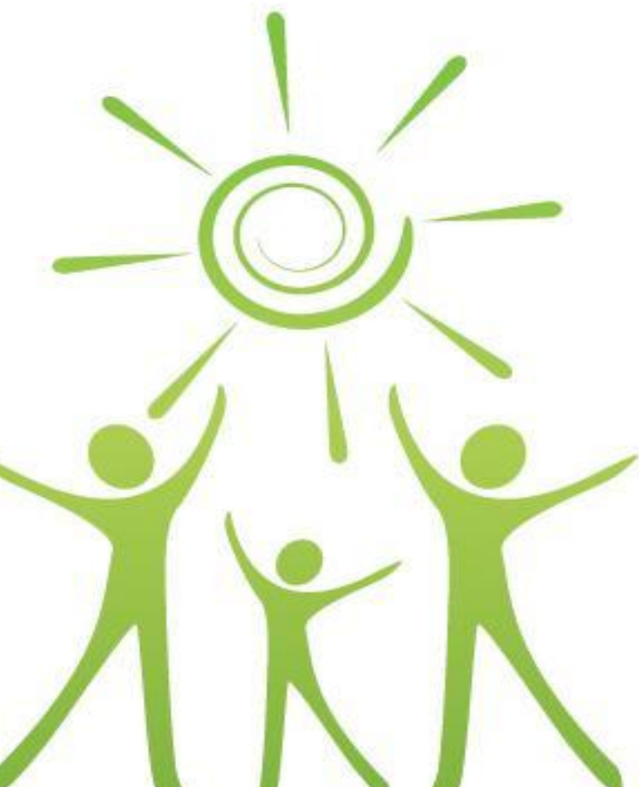
Попади в цель