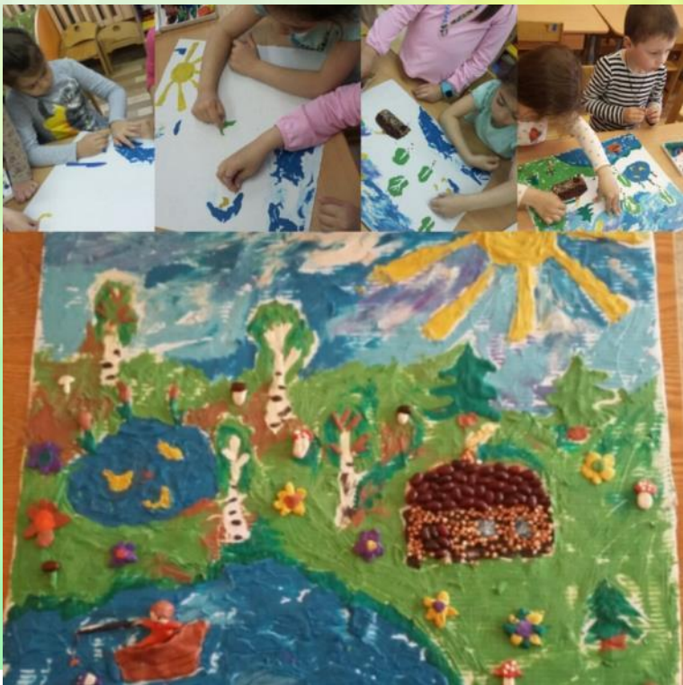
Коллективная работа (налеп из пластилина) «Лето!»