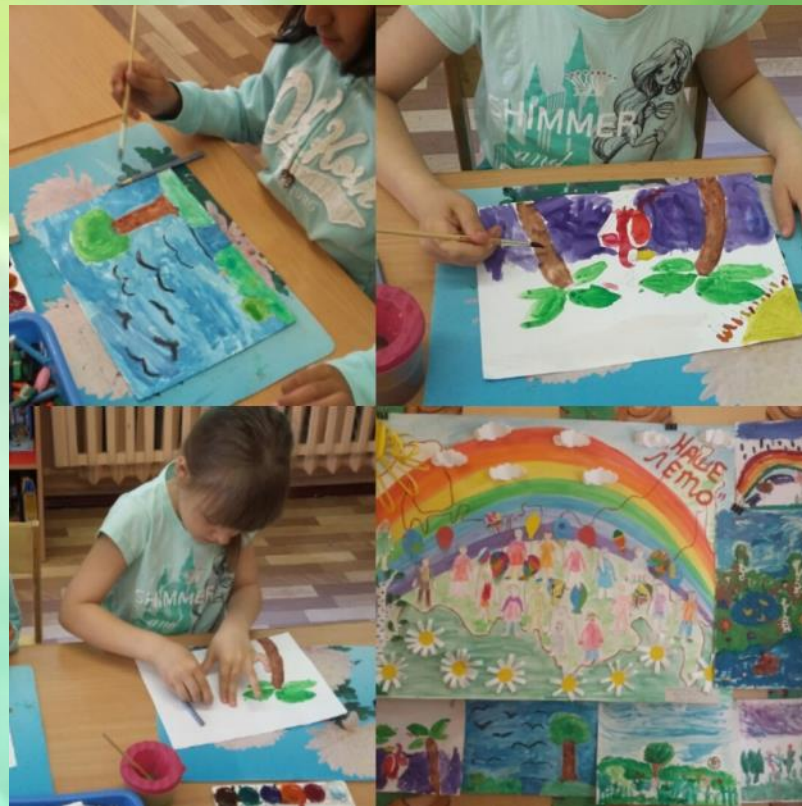
Коллективная работа «Лето-это маленькая жизнь!»