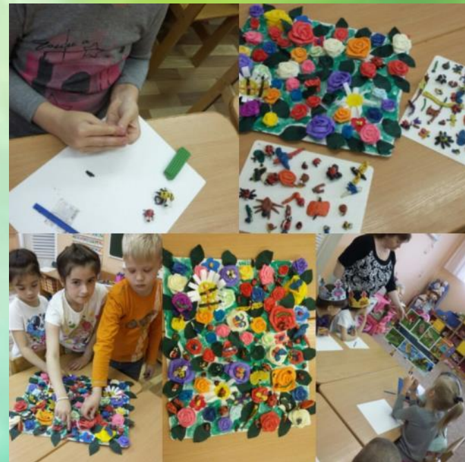
Коллективная работа «Кто на клумбе живет!»