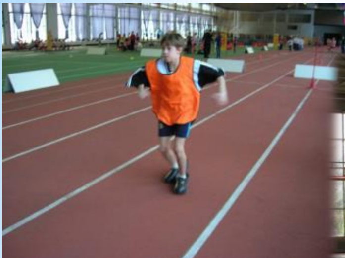
«Веселые старты» окожные соревнования 2002 год