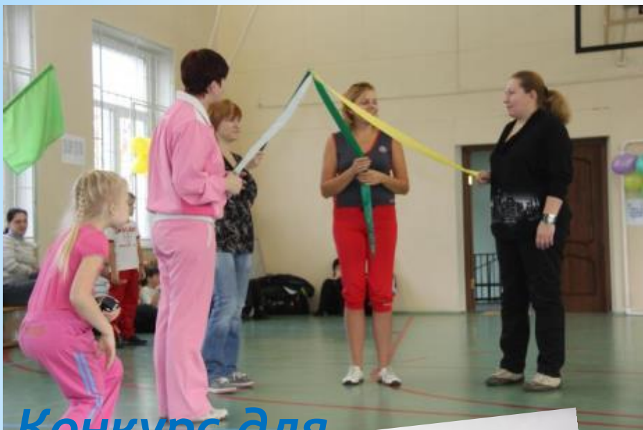
Конкурс для мам