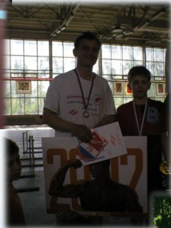
Первенство г. Москвы среди семейных команд 2012 год