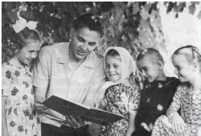
Василий Александрович Сухомлинский

Воля — это способность делать выбор и совершать действия, это свойство человека, заключающееся в его способности сознательно