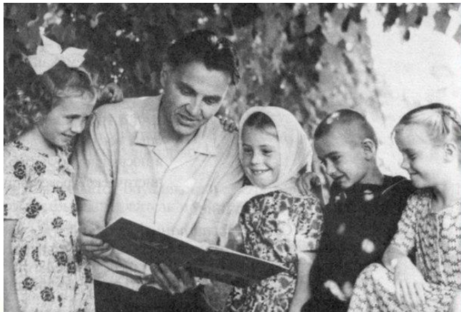
Василий Александрович Сухомлинский

Воля — это способность делать выбор и совершать действия, это свойство человека, заключающееся в его способности сознательно