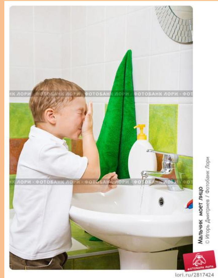
Мальчик моет лицо