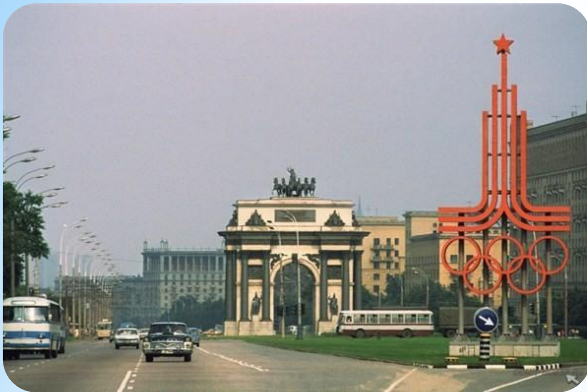
Москва - 1980г. Летние Олимпийские игры