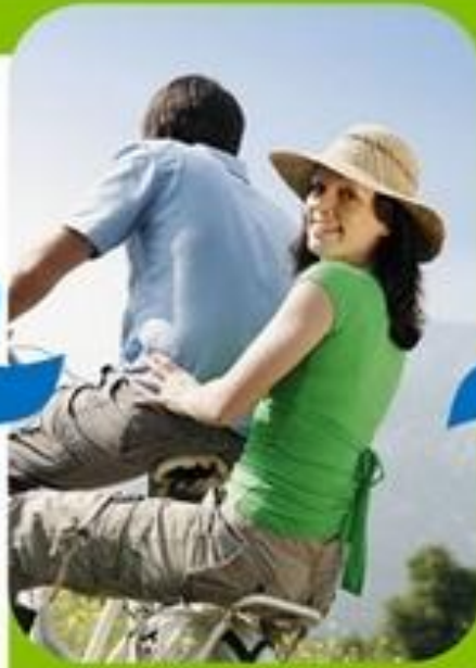
Активный образ жизни