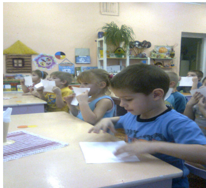
Упражнение «Ветерок» на занятии «От куда берутся болезни»