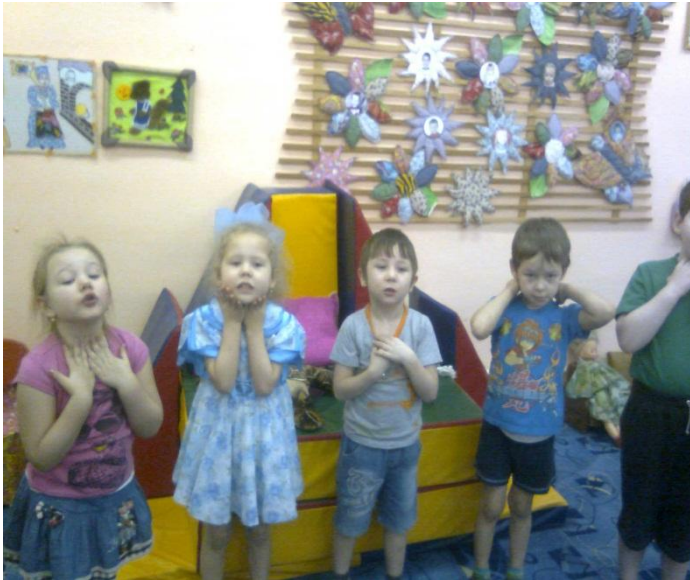
Массаж биологически активных зон «Обезьяна Чи-чи-чи»

Массаж биологически активных зон, предотвращает простудные заболевания. Такие упражнения я беру в зависимости от тематики занятий. Например естественно научные наблюдения раздел «Человек»