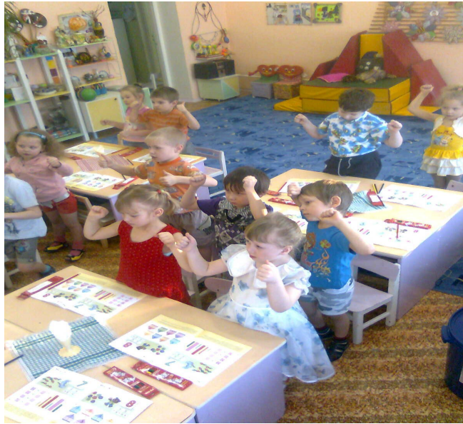
Пальчиковая игра «Зайчик и ушки»

В каждое занятие включаю пальчиковые игры или массаж пальцев.