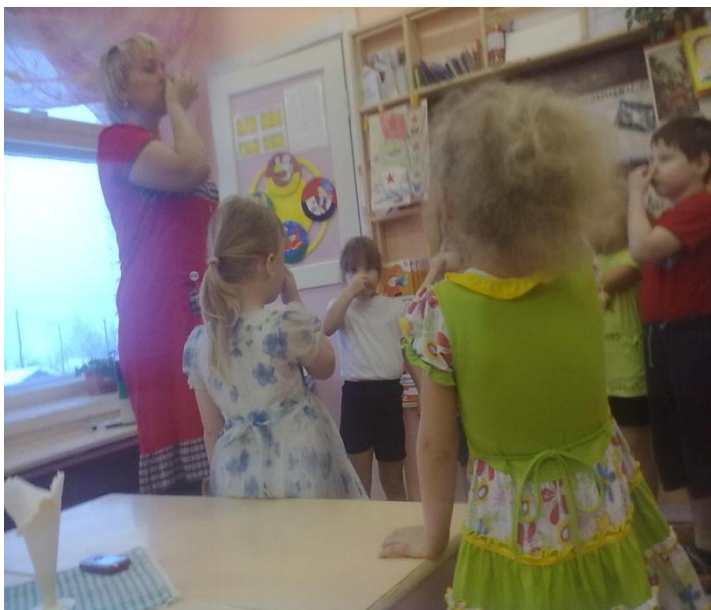
Упражнение «Водолазы». На занятии «Наши защитники»

Включаю в занятия ( худ. литература, развитие речи, экологическое воспитание)