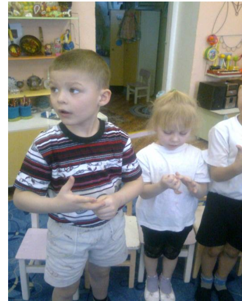
Массаж пальцев «Рукавицы»

В насыщенности акупунктурными зонами кисть не уступает уху и стопе. В восточной медицине существует убеждение, что массаж большого пальца повышает функциональную активность головного мозга, указательного – положительно воздействует на состояние желудка, среднего – кишечник, безымянного – на печень и почки, мизинца – на сердце.