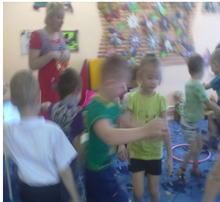
Подвижная игра «Самолеты»