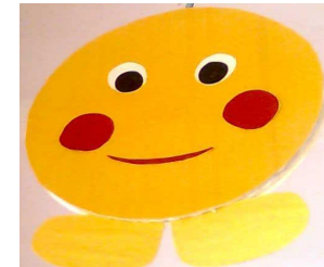
Мобилы по сказке «Колобок»

Сначала гимнастику для глаз подбираю без фиксации взгляда на пальце, палочке или других предметах, так как детям сложно выполнять манипуляции с предметами. В старших группах дети уже свободно владеют фиксацией взгляда на любом предмете. На занятиях использую подвесные мобилы.