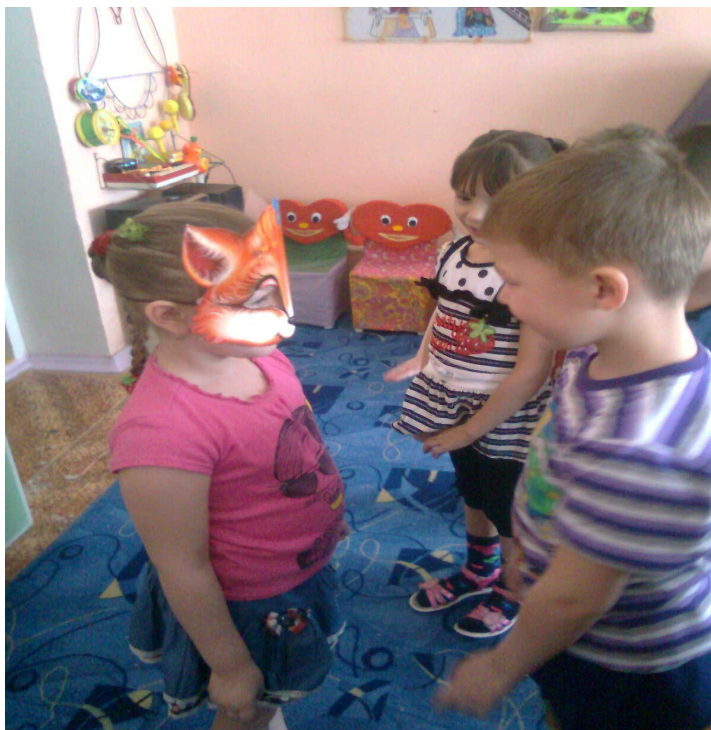
Подвижная игра «Белые гуси»

На занятиях очень часто использую подвижные и коммуникативные игры.