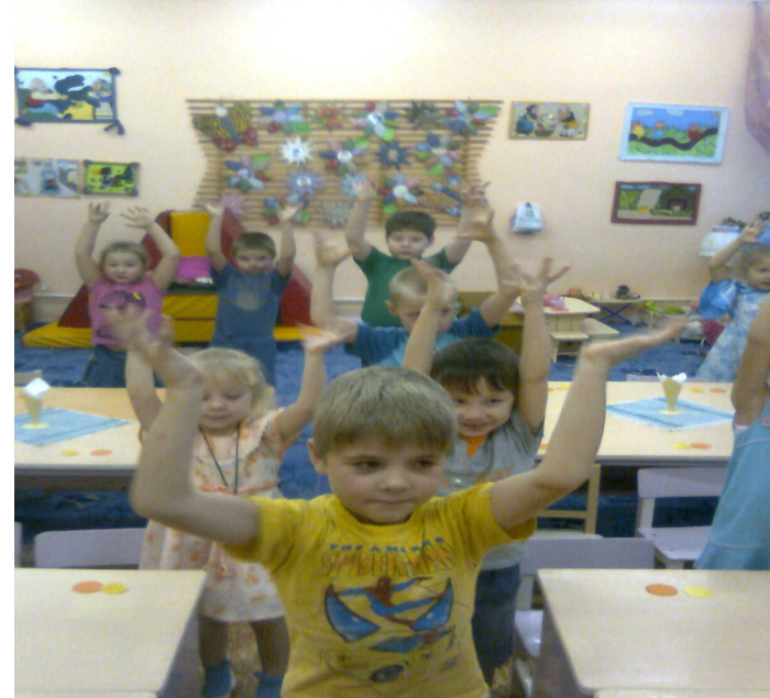
Массаж биологически активных зон «Снегири»