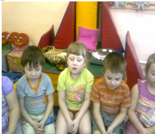
Упражнение на релаксацию «Послушай как шумит ветер»