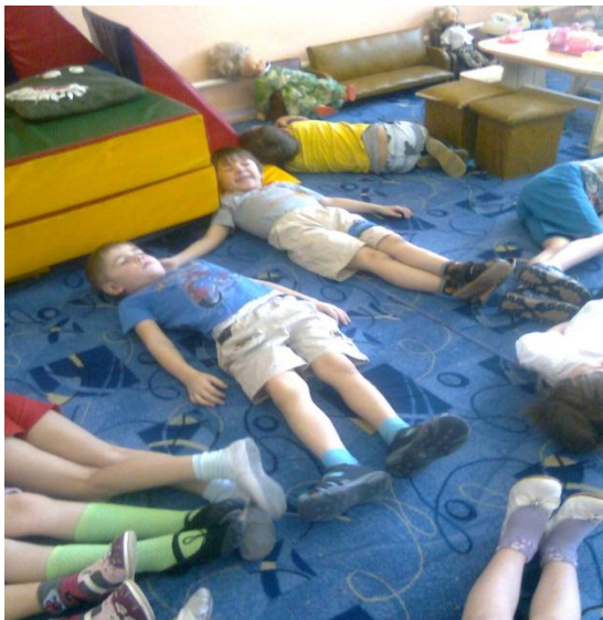
Упражнение на релаксацию «Звери и птицы спят»

В зависимости от сюжета занятий включаю упражнения на релаксацию.