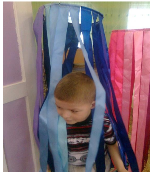
«Сухой дождик» для снятия эмоционального напряжения