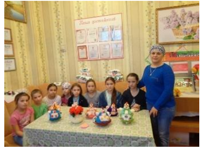
Кружок «Умелые руки»