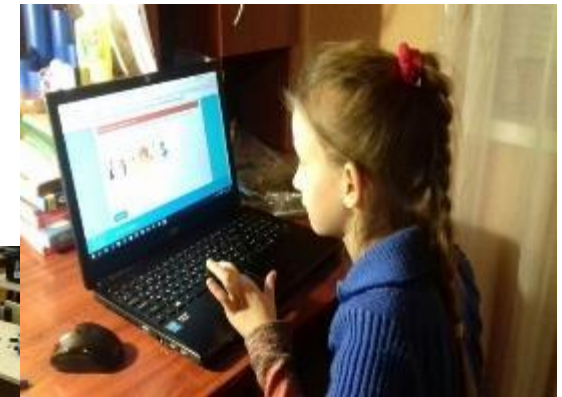
Дистанционные занятия на платформе Учи.ру