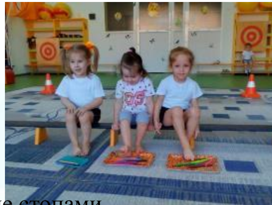
Коллективное рисование стопами