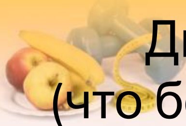
Диаграмма опроса детей (что больше всего понравилось?)