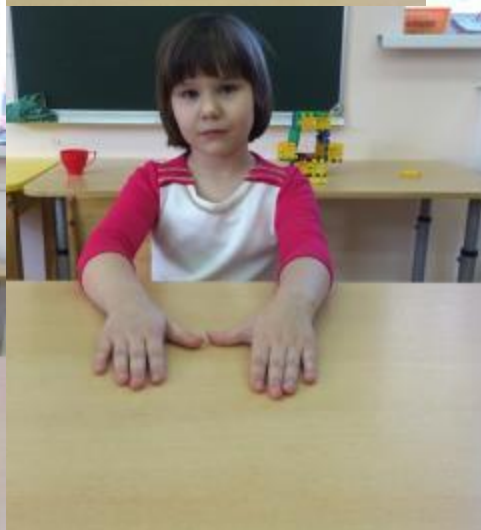
Кулак- ребро - ладонь