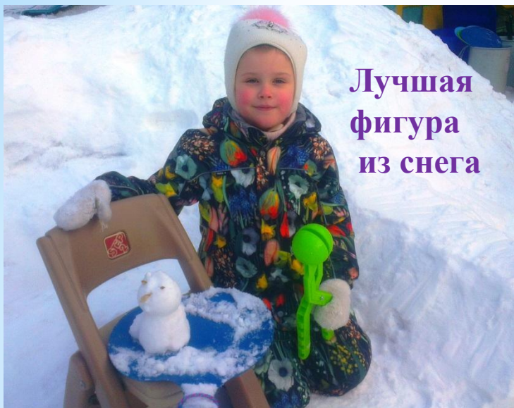
Лучшая фигура из снега