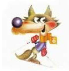
волчонок Вучко 1984г. Сараево (Югославия)