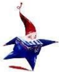
горный эльф Мажик 1992г. Альбервилль (Франция)