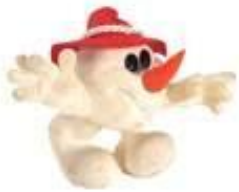
снеговик Олимпиямандл 1976г. Инсбрук (Австрия)

Для каждой Олимпиады принимающей страной выбирается ТАЛИСМАН. Обычно талисманом выбирают какое-либо животное или иной символ