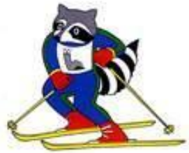
енот Рони 1980г. Лейк-Плэсид (США)