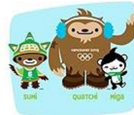
Куачи, Мига и Суми 2010г. Ванкувер (Канада)