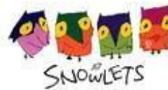
Сукки, Нокки, Лекки и Цукки 1998г. Нагано (Япония)