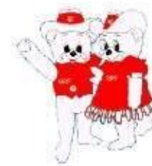
полярные медведи Хайди и Хоуди 1988г. Калгари (Канада)