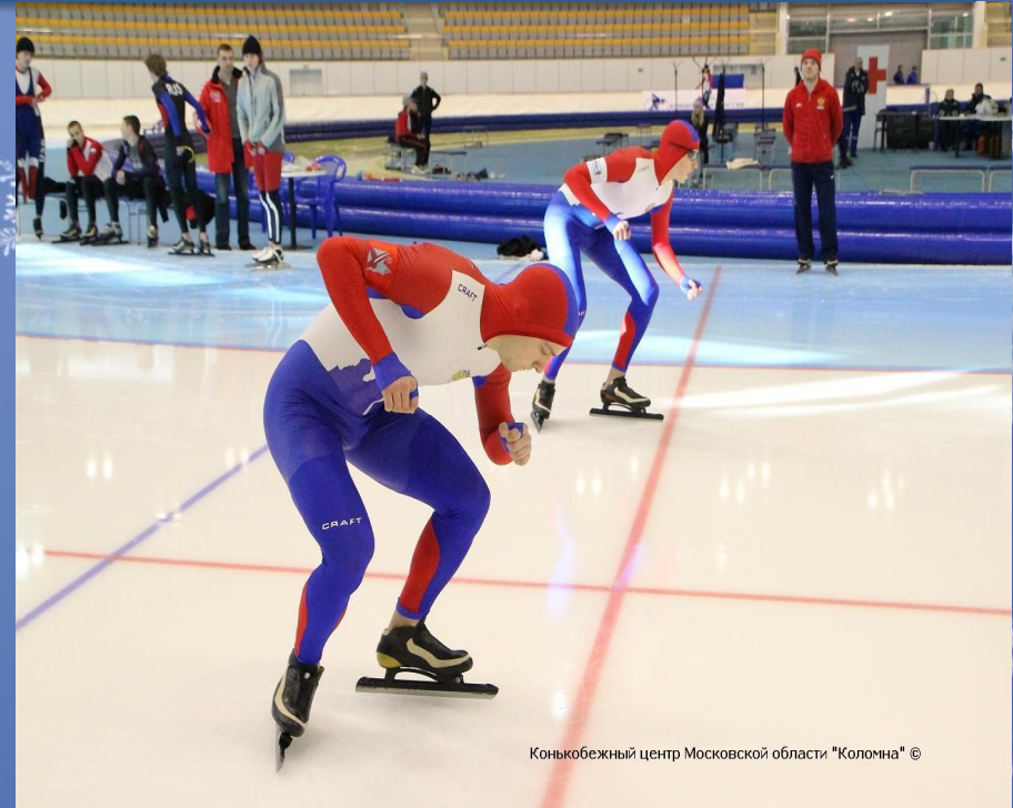
Конькобежный центр Московской области "Коломна" ©