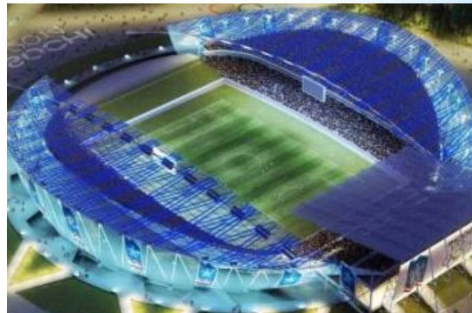
Олимпийский огонь Сочи 2014