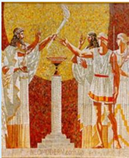
Олимпийский огонь Древняя Греция