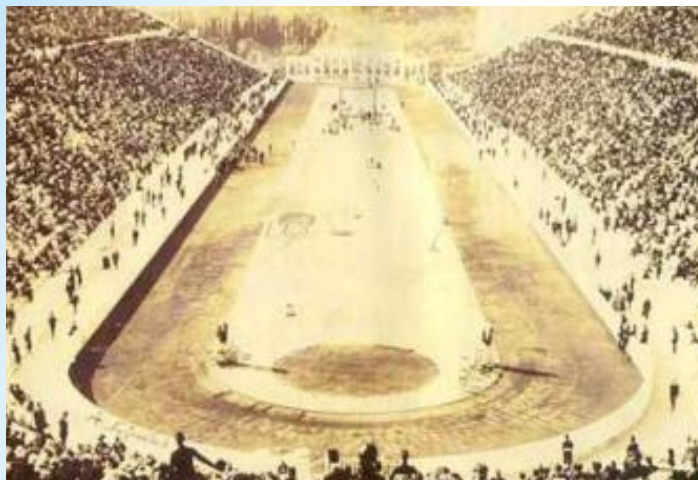
Олимпийский огонь Древняя Греция