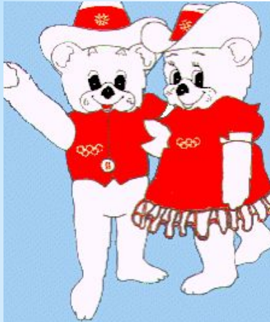
Хайди и Хоуди