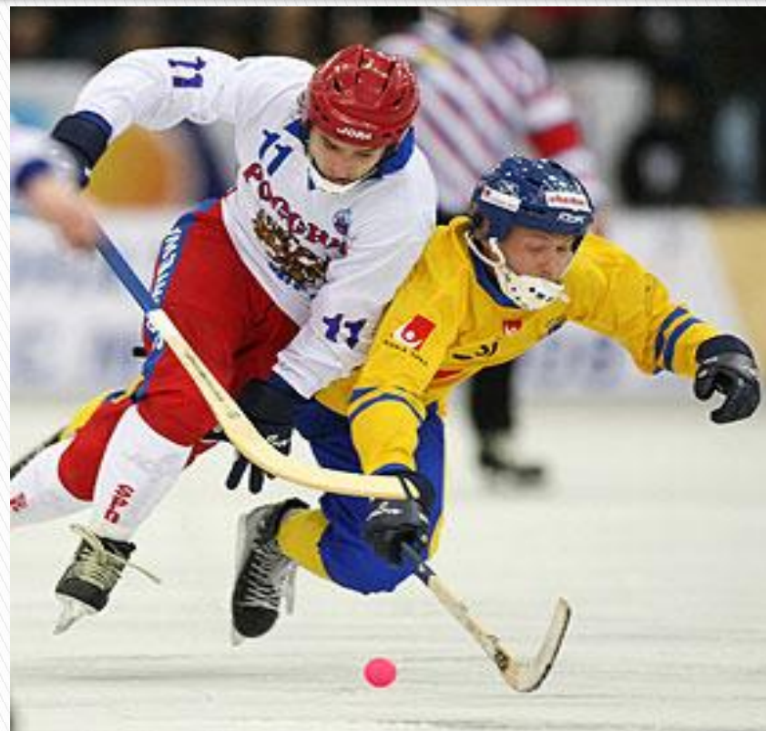
Хоккей с мячом