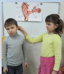
«Ушки на макушке»