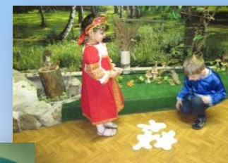
Драматизация «Сестрица Аленушка и Братец Иванушка»