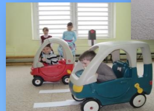
Сюжетно-дидактическая «Пешеходный переход»