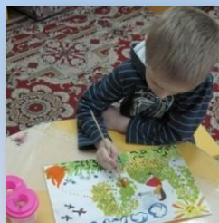
«Огонь – друг или враг?»