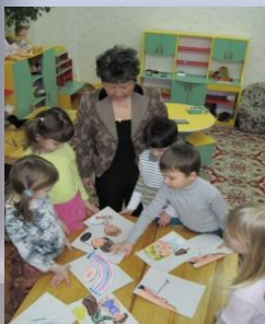
«Ушки на макушке»