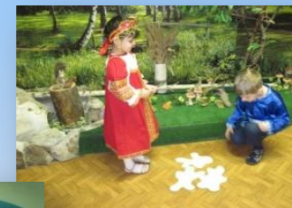
Драматизация «Сестрица Аленушка и Братец Иванушка»