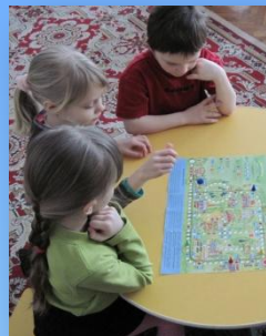
Настольная «Дорожные знаки»