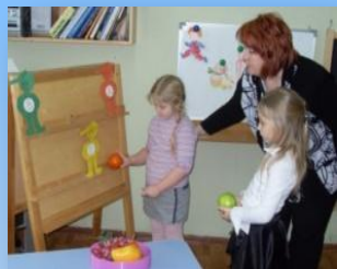
«В стране Неболейке»