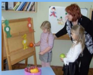
«В стране Неболейке»