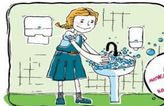
Намыливаем руки в течение 20 секунд

Моем между пальцами, запястья, кончики пальцев