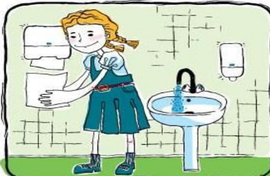
Вытираем руки бумажным полотенцем