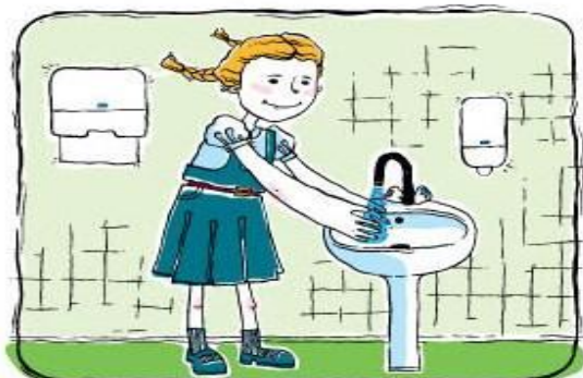
Ополаскиваем руки теплой водой