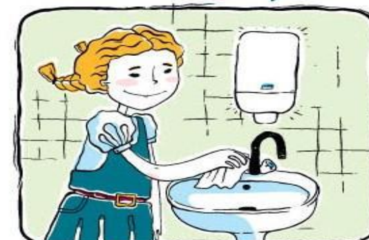
Закрываем кран через полотенце