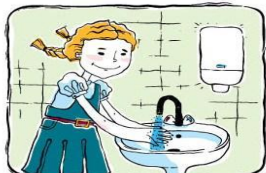
Смываем мыло и бактерии

Моем между пальцами, запястья, кончики пальцев