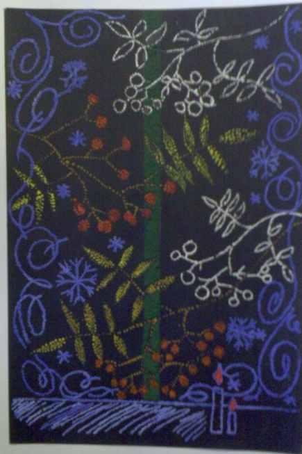
Лилия Мислов, 17 лет