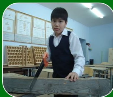
Система, позволяющая перейти от репродуктивных действий к творческим