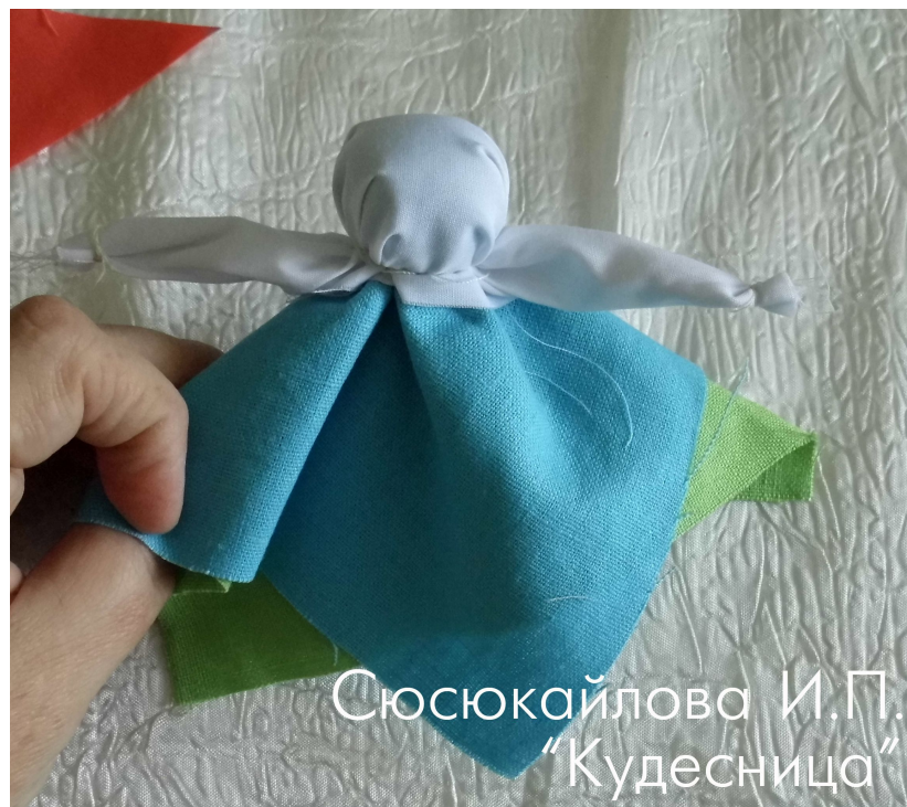
Сюсюкайлова И.П. "Кудесница"

Расправляем стороны белого лоскутка, собираем их и на концах перевязываем, формируя руки куклы.