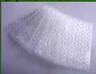
Воздушно- пузыр- чатая пленка