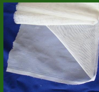
Сетка или тюль