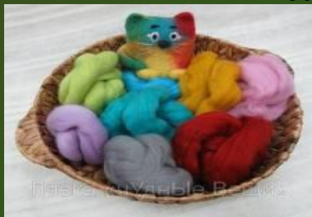
Мериносова я шерсть