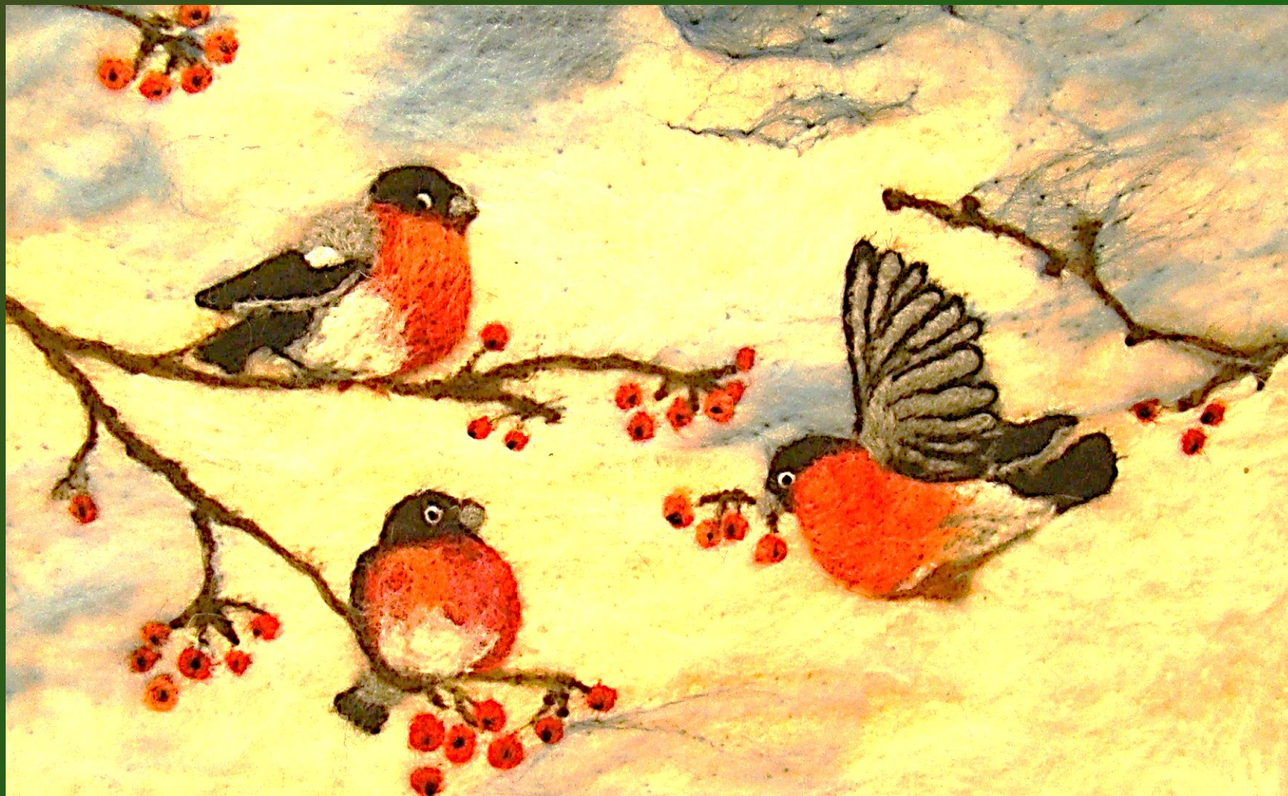
Авторская работа Березиной Риммы Анатольевны «Снегири»