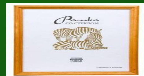
Рама для картины