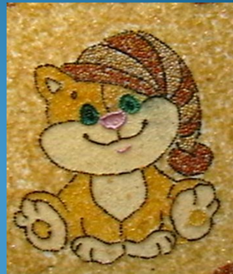
4. «С добрым утром»