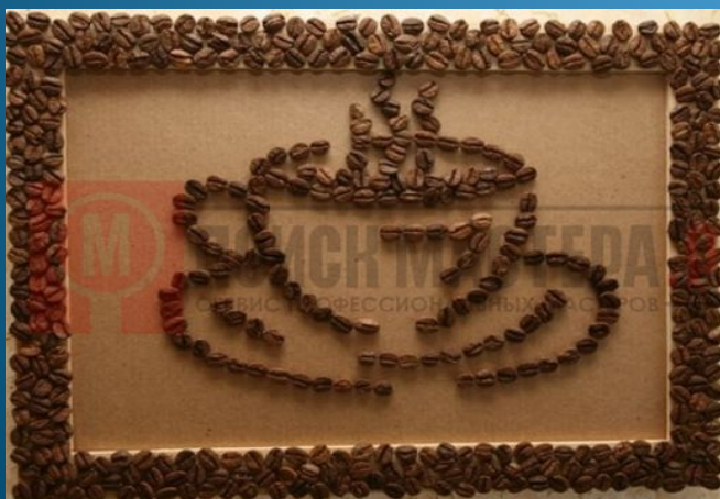
5. «Сладкая парочка»