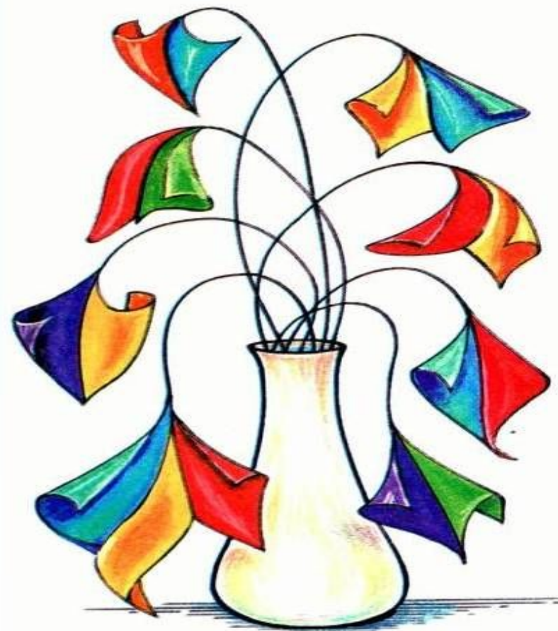
Гармоничное сочетание цветов