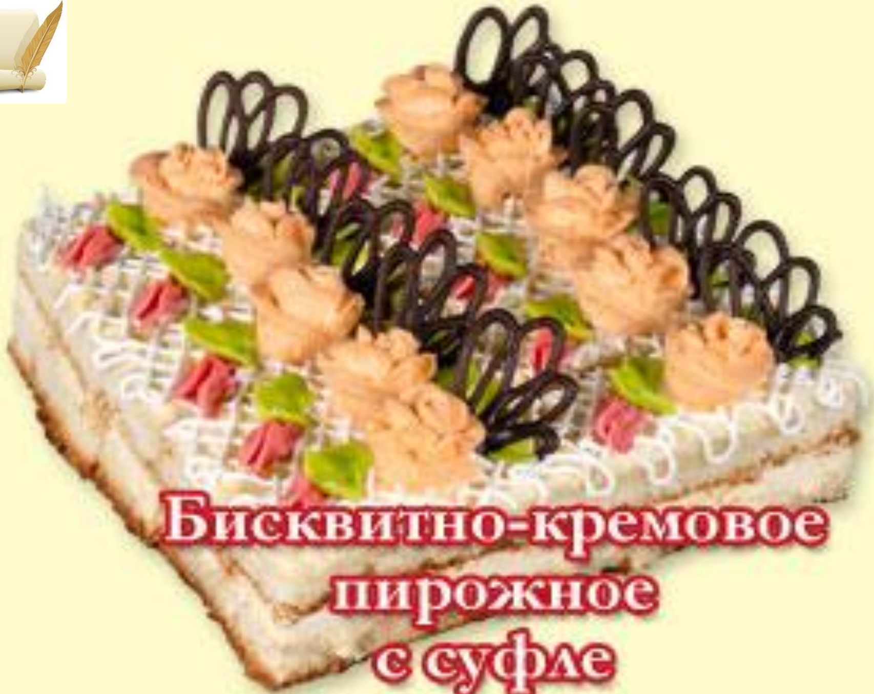
Бисквитно-кремовое пирожное с суфле