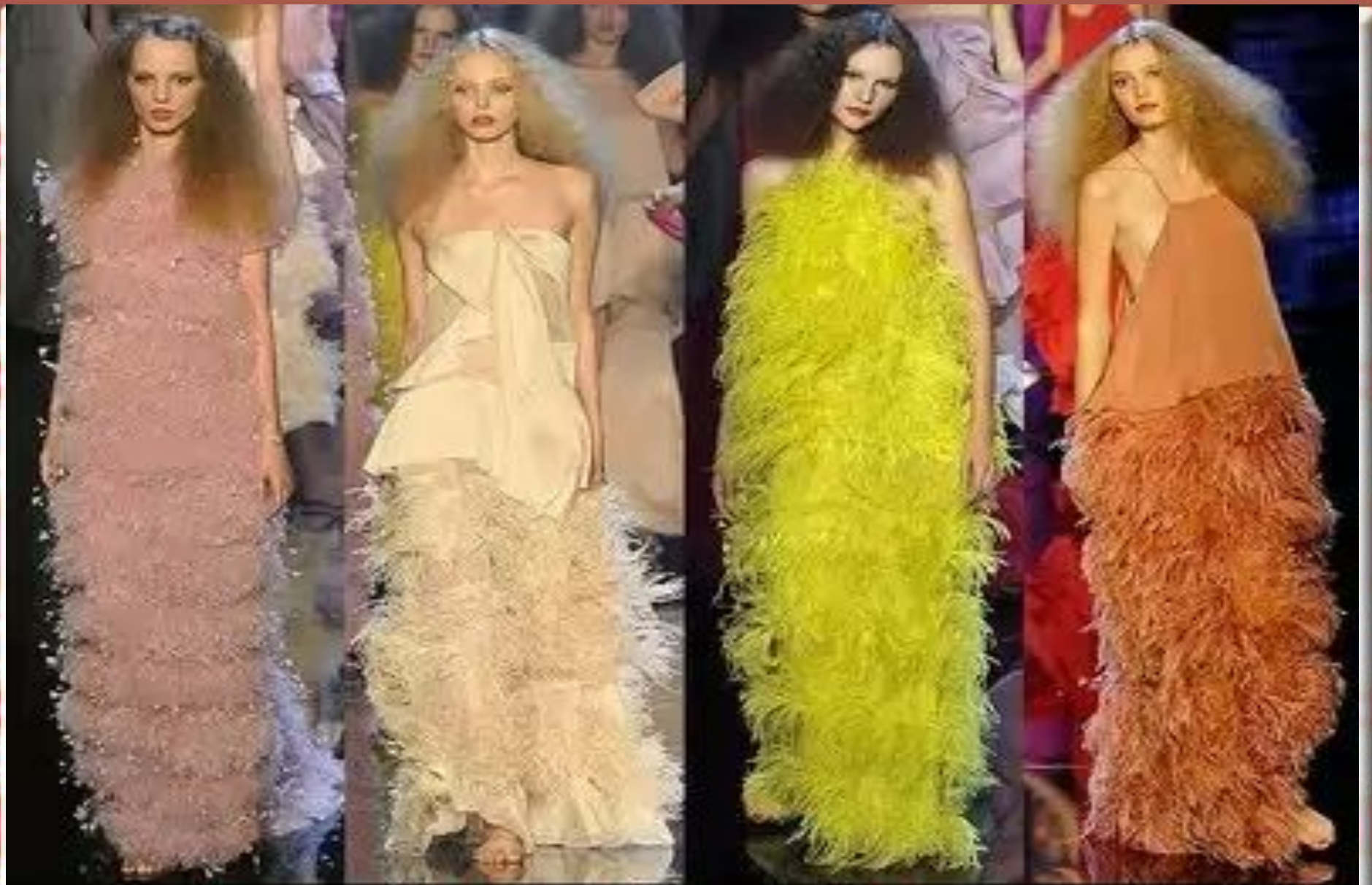
Tiered/Feathered Gowns myJulia.Ru