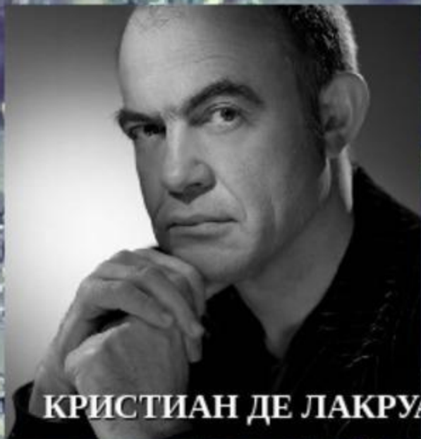
КРИСТИАН ДЕ ЛАКРУА