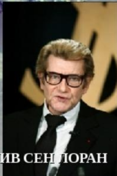
ИВ СЕН ЛОРАН