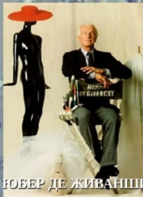
РОБЕР ДЕ ЖИВАНШИ