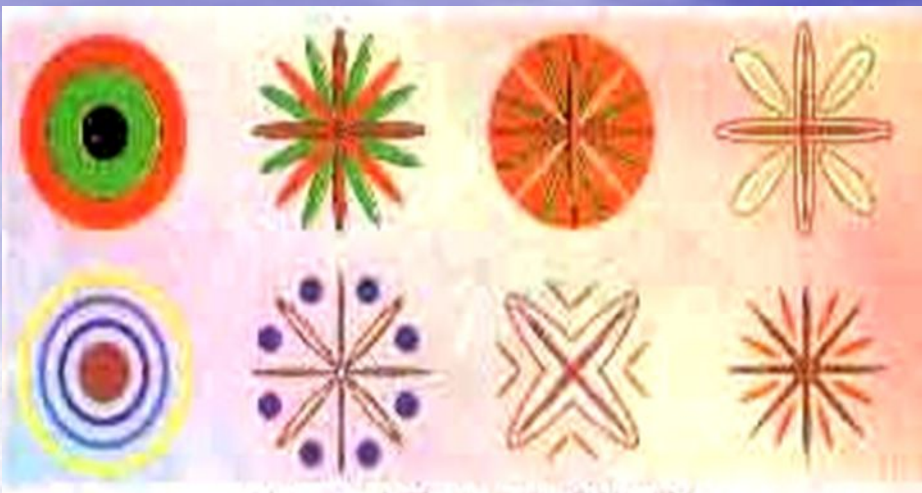
Так изображали Солнце