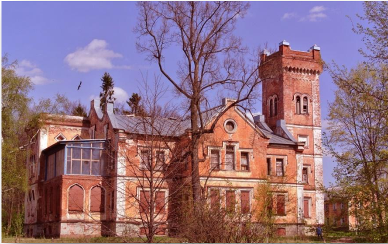
Усадьба помещика Нехлюдова