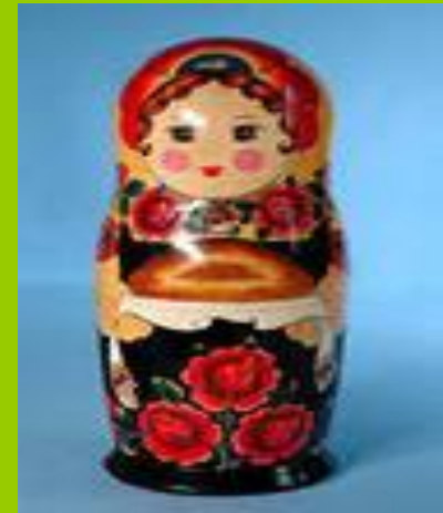
Рисунок на изделие вначале наносится тушью, а уже потом заполняется цветом.

Полховомайдановская роспись - особенная. Каждая из деталей головного убора, сарафанного убранства матрешки выписывается отдельно.