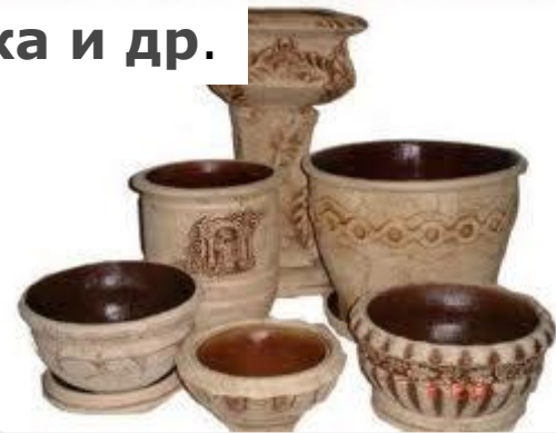
Керамика и др.