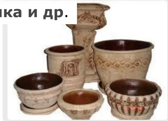
Керамика и др.