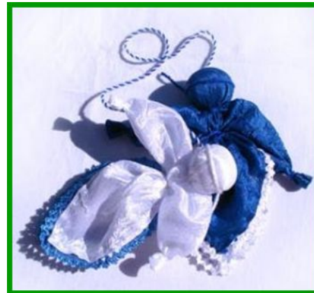
День и Ночь