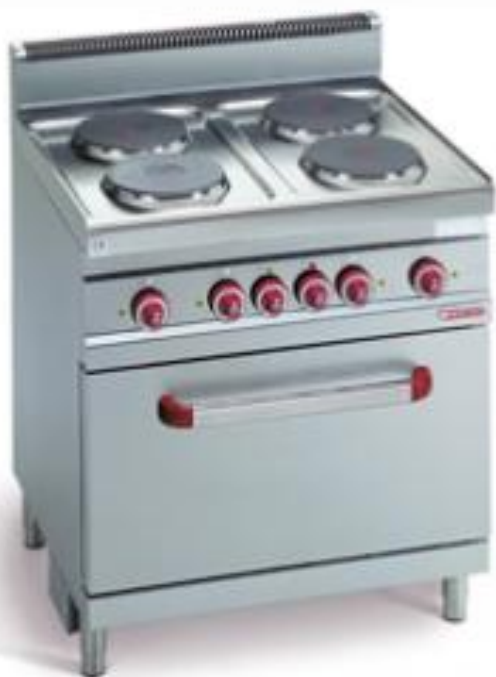
ПЛИТА ЭЛЕКТРИЧЕСКАЯ СТАЦИОНАРНАЯ