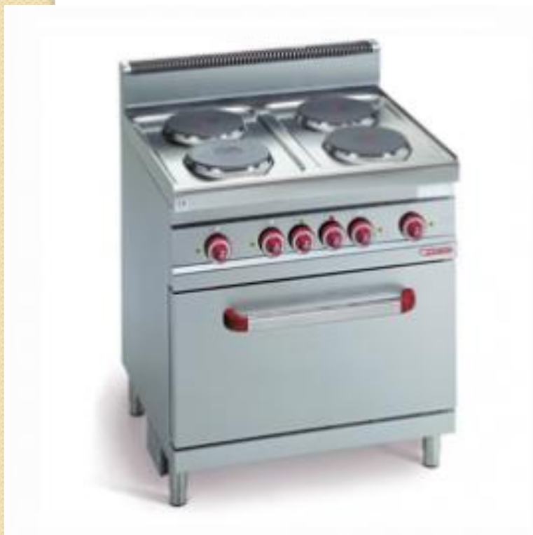
ПЛИТА ЭЛЕКТРИЧЕСКАЯ СТАЦИОНАРНАЯ