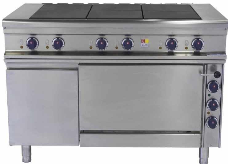
ПЛИТА ИНДУКЦИОННАЯ стационарная