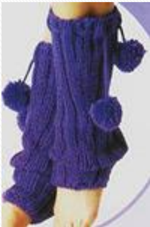
ГЕТРЫ С БУБОНЧИКАМИ

БЛАГОДАря ОГРОМНОМУ ВЫБОРУ ИНСТРУМЕНТОВ И ПРЯЖИ МОЖНО СДЕЛАТЬ ИЗДЕЛИЯ И ДЛЯ НОГ. Я РАССКАЖУ О НЕКОТОРЫХ ИЗ НИХ.