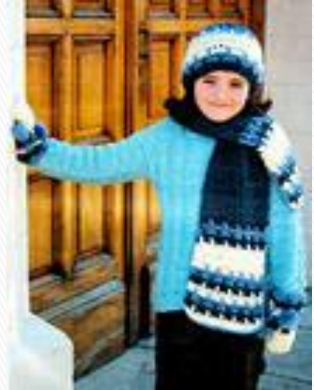
ШАПКА С ШАРФОМ