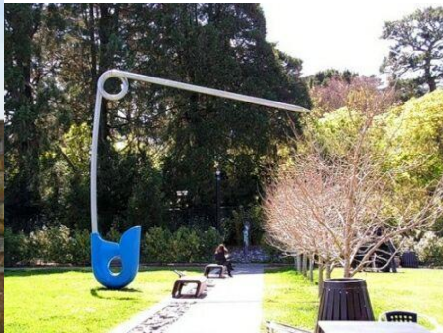
И не менее красивый памятник булавке в Сан-Франциско, США.