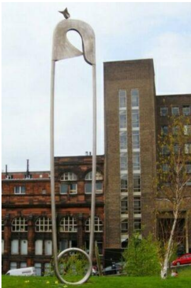
Памятник булавке в Глазго, Великобритания.