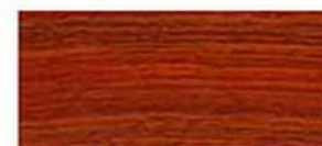
Радаук - Падук