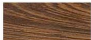
Зебрано - Зебрано