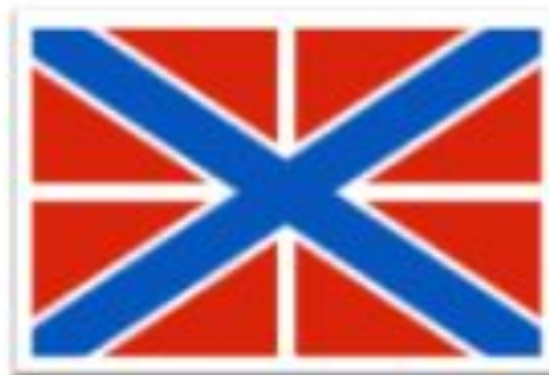
Гюйс кораблей и судов ВМФ России