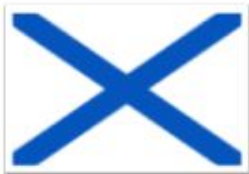
Флаг кораблей и судов ВМФ России