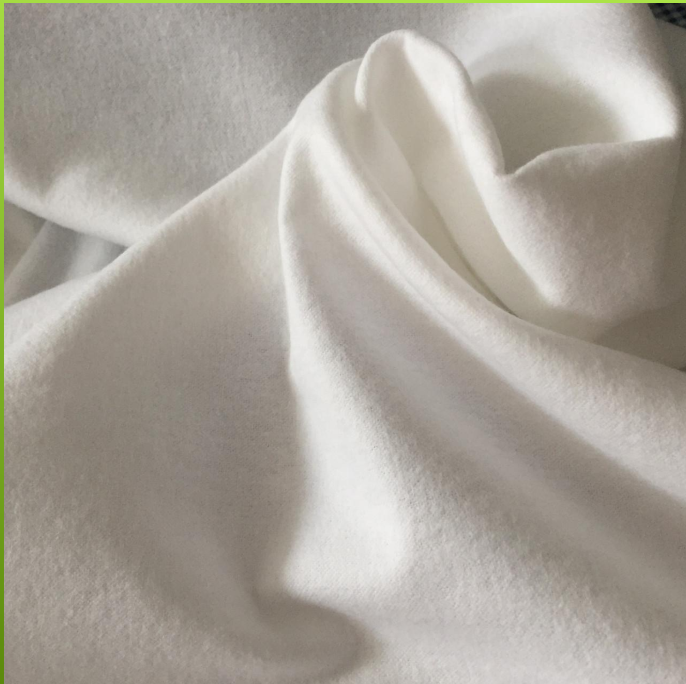
▶ Фланель байка