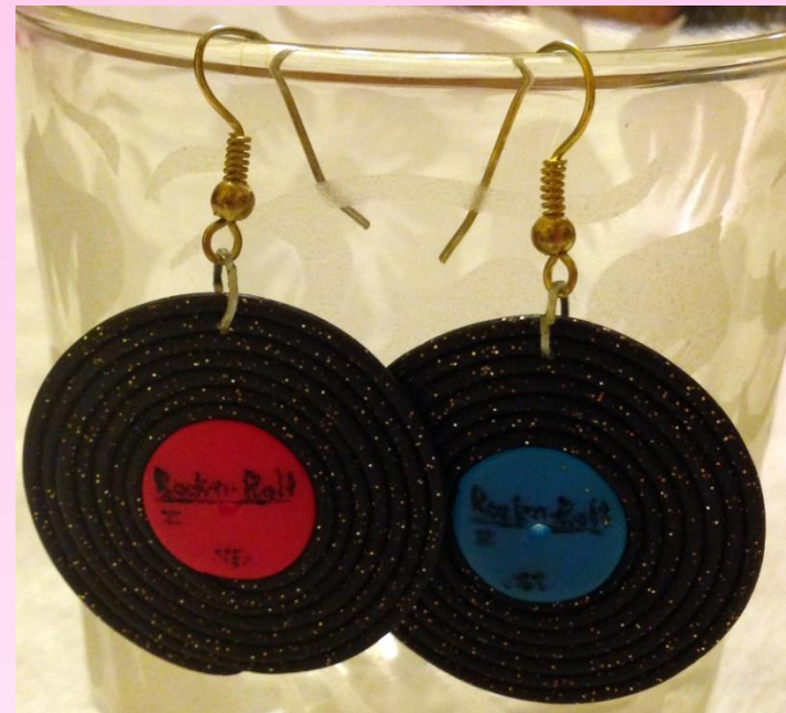
Серьги: «Виниловые пластинки»

Конечно, украшения из полимерной глины можно купить и в магазине, но тогда вы уже не будете обладательницей кольца, бус или сережек, которых больше ни у кого нет.