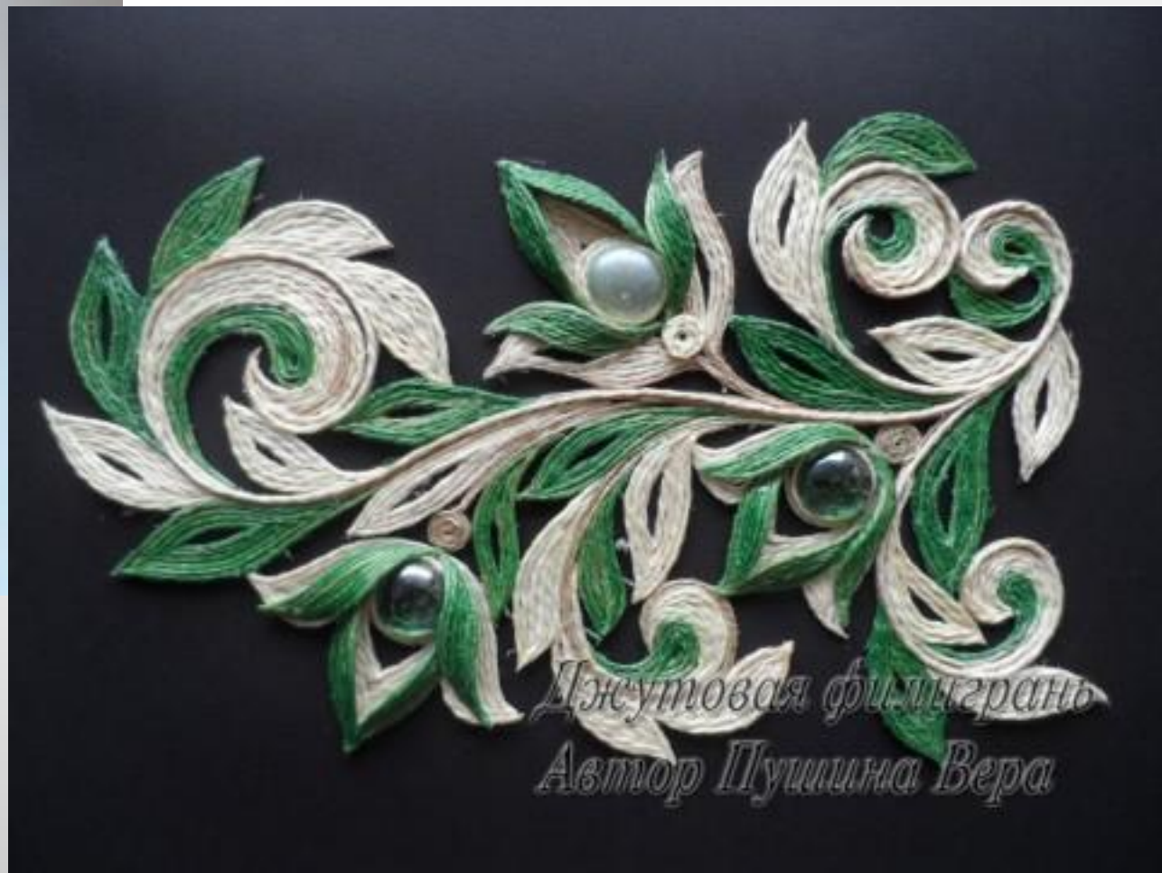
Джутовая филигрань Автор Пушина Вера