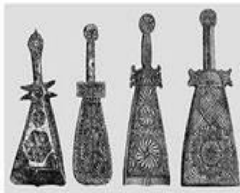
Рис. 16. АНТРОПОМОРФНЫЕ ВАЛКИ ДЛЯ СТИРКИ ОДЕЖДЫ СО ВРАСАМИ ЗЕМЛИ И СОЛНЦА Общий вид, сзади, сверху, восторженное божество Матисса