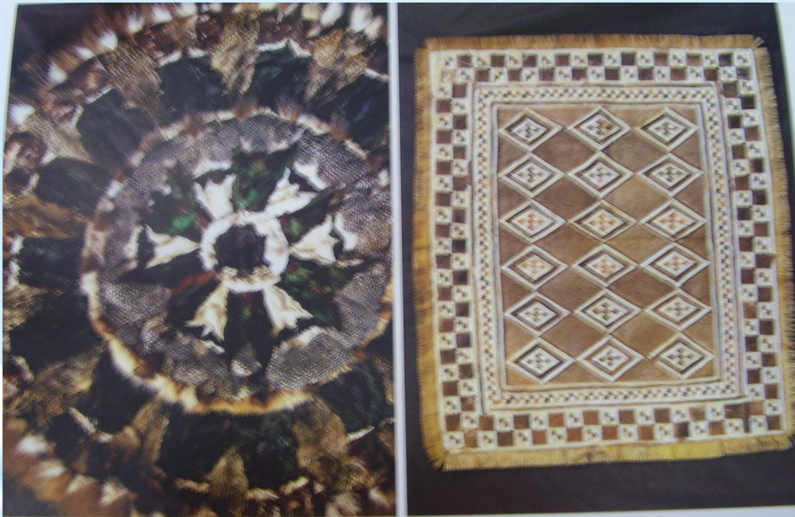
* Меховая мозаика