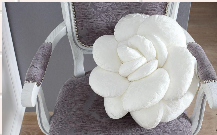
Подушки в форме цветов