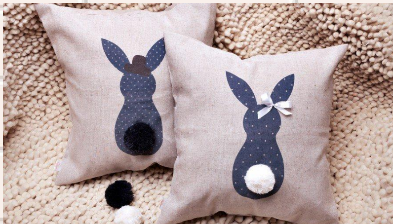
Подушки с аппликацией