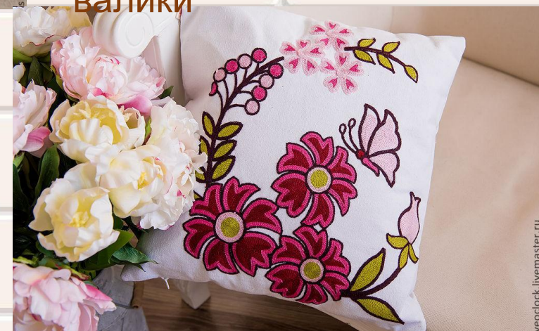
Подушки с вышивкой