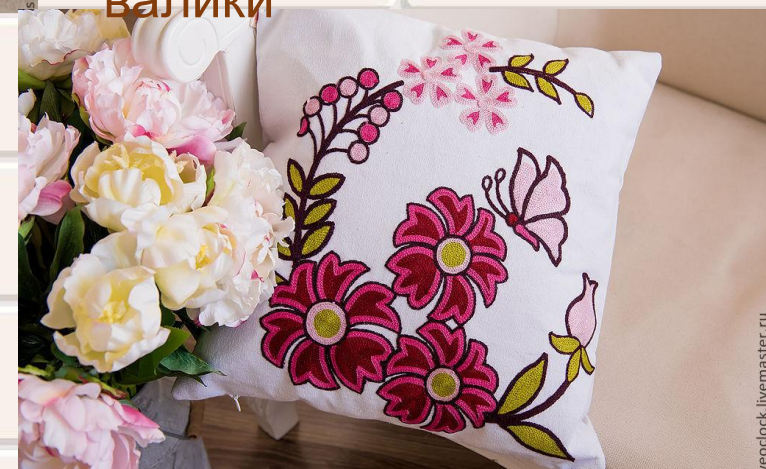
Подушки с вышивкой