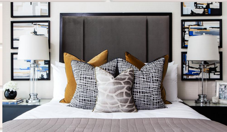
Обычная диванная подушка