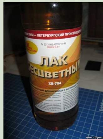
Лак бесцветный по дереву