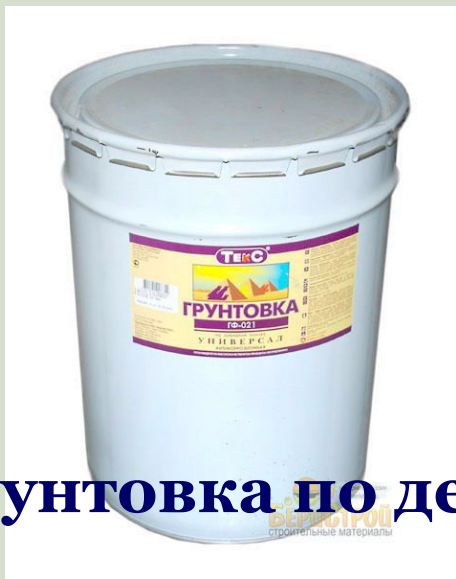
Грунтовка по дереву