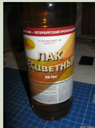
Лак бесцветный по дереву