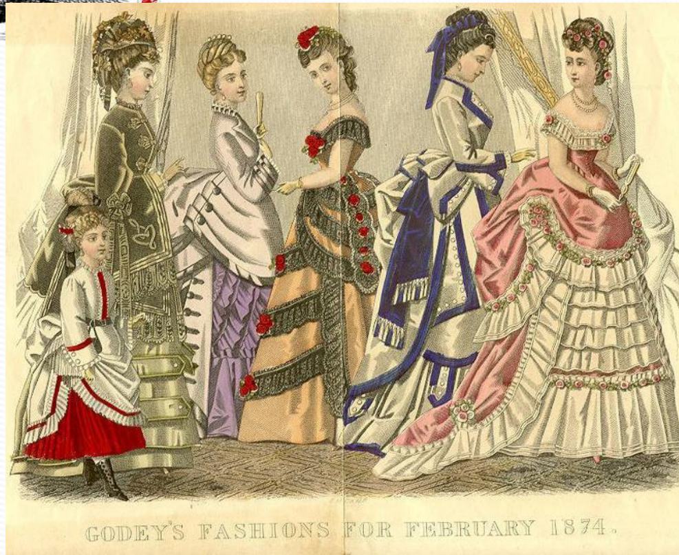
GODEY'S FASHIONS FOR FEBRUARY 1874.