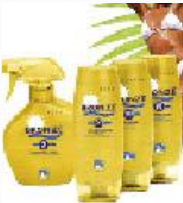
Масло для загара.